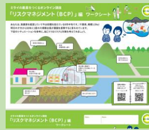
ワークシート (A3片面印刷推奨)