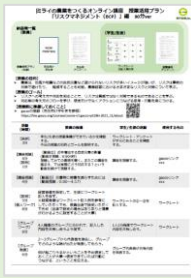
授業活用プラン (本紙)